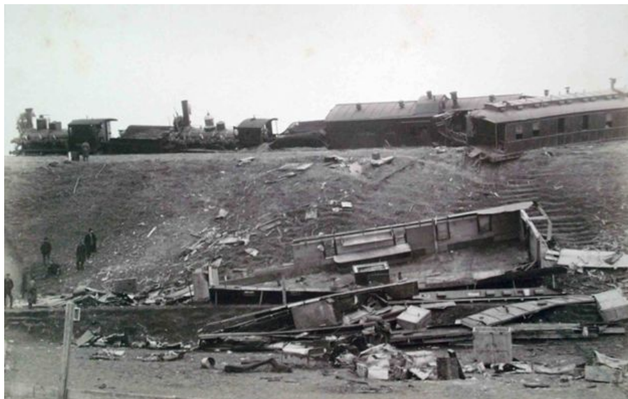
фотография А.М. Иваницкого

одновременно в рамках Конкурса олимпиадных работ школьников на призы Следственного комитета Российской Федерации)